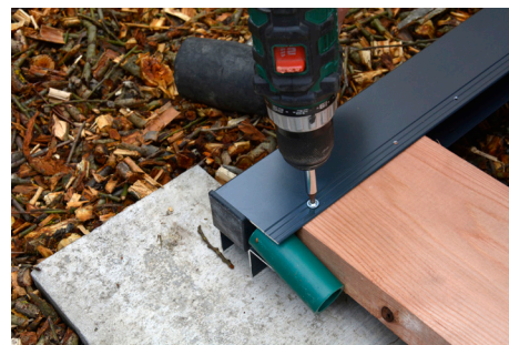
3. Dosku dotlačte gumovou paličkou do profilu a priskrutkujte. Pokračujte protiahlým rohom.