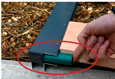
2. Začínáme odspodu - nasadíme záslepky a použijeme dištančný valček - profil je predvŕtaný tak, aby sa v spodnej časti vytvorila medzera pre prístup vzduchu