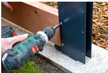
4. Najprv priskrutkujte T-kusy na vonkajšie obvodové strany záhona. Potom vložte priečne dosky.