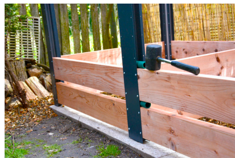
6. Dištančné valčeky používajte na každom poschodí a po priskrutkovaní dosky ich odstráňte.