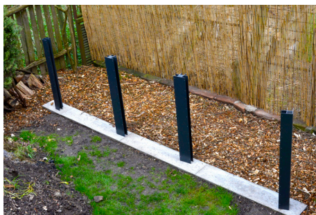
1. Pripravte si zvonku predvŕtané hliníkové profily, ktoré chcete mať rozoberateľné.

Na spodnú stranu hliníkového profilu (tá s väčšou medzerou medzi koncom a prvým prevŕtaným otvorom), si ešte pred zostavením nasadíte záslepky.