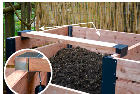
8. Voliteľné príslušenstvo: Spevňujúcu dosku vložíme do 15cm profilov a nasadíme na hornú časť kompostéra. Až potom dosku priskrutkujeme.