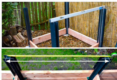
5. Skontrolujte, či je všetko v rovine a či sú rozostupy profilov v hornej časti zhodné s prvou vrstvou.